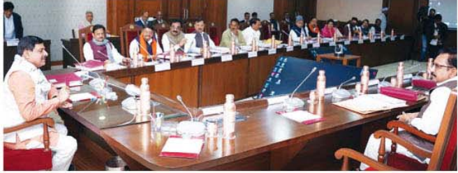
मुख्यमंत्री डॉ. मोहन यादव ने मंत्रालय में आयोजित मंत्रिपरिषद की बैठक को संबोधित किया

भोपाल, मुख्यमंत्री डॉ. मोहन यादव की अध्यक्षता में मंत्रिपरिषद की बैठक मंत्रालय में सम्पन्न हुई। मंत्रिपरिषद द्वारा प्रदेश के युवाओं के समग्र सामाजिक-आर्थिक विकास के उद्देश्य से युवा-उन्मुखीकरण की गतिविधियों को समन्वित रूप से एक ही मंच पर लाने के लिए स्वामी विवेकानंद युवा शक्ति मिशन प्रारंभ करने की सैद्धांतिक स्वीकृति प्रदान की गई है।