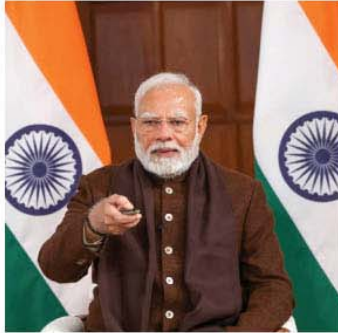
प्रधानमंत्री श्री नरेन्द्र मोदी ने वीडियो कॉन्फ़ेरेंसिंग के माध्यम से विभिन्न रेलवे परियोजनाओं का उद्घाटन किया

प्रधानमंत्री श्री नरेन्द्र मोदी ने वीडियो कॉन्फ़ेरेंसिंग के माध्यम से विभिन्न रेलवे परियोजनाओं का उद्घाटन किया और आधारशिला रखी। प्रधानमंत्री ने नए जम्मू रेलवे डिब्बाघर का उद्घाटन, पूर्वी तटीय रेलवे के रायगढ़ रेलवे मंडल भवन की आधारशिला और तेलंगाना में चरलापल्ली नए टर्मिनल स्टेशन का उद्घाटन किया। इस अवसर पर प्रधानमंत्री ने कहा कि वर्ष 2025 के आरंभ में ही भारत ने अपने मेट्रो रेल नेटवर्क को एक हजार किलोमीटर से अधिक तक विस्तारित करने के साथ अपनी पहलू को गति दे दी है। उन्होंने कहा कि यह कार्यक्रम इस बात को प्रमाणित करता है कि पूरा देश एक साथ कदम से कदम मिलाकर आगे बढ़ रहा है और जम्मू-