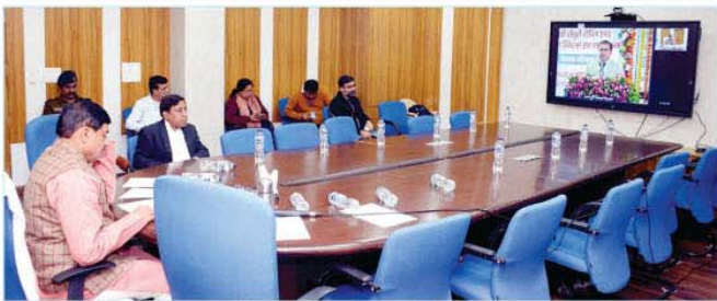
मुख्यमंत्री डॉ. मोहन यादव वीडियो कॉन्फ्रेंसिंग के जरिये शिक्षकों के प्रथम दल को संबोधित करते हुए

उज्जैन, मुख्यमंत्री डॉ. मोहन यादव ने उज्जैन के एनआईटी के चर्चुअली बुद्धकर 'स्टास परियोजना' के तहत अंतर्राष्ट्रीय शैक्षणिक प्रथम के लिए सिंगापूर जाने वाले चयनित शिक्षकों को संबोधित किया। मुख्यमंत्री ने कहा कि हमारी पुरातन गुरुकुल परम्परा आज भी प्रासंगिक है। आज कई विकसित देश हमारी पुरानी गुरुकुल परम्परा को अपनाकर अपने बच्चों को शिक्षा दे रहे हैं। हम प्रदेश में नलास के अंदर और नलास के बाहर भी विद्यार्थियों को जीवन एवं नैतिक मूल्य तथा व्यावहारिक शिक्षा देकर उनके समग्र विकास की ओर बढ़ रहे हैं। मजबूत इरादों और शैक्षणिक गुणवत्ता में आमूल-मूल सुधार लाकर हम प्रदेश को शिक्षा के मामले में देश का एक मॉडल एजुकेशन स्टेट बनायेंगे।