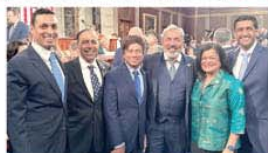
2020 में थे भारतीय मूल के चार सांसद

बेस्ट फिल्म (नॉन इंग्लिश) कैटेगरी में आल्टी वी इमेजिन एबू लाइफ के अलावा एमिलिया पेरेज, द गर्ल विद द नीडल, आई एम रिटल हेयर, द सीड ऑफ द सीक्रेड फिग एंड वॉर्मलोड जैसी फिल्में भी शामिल थीं।