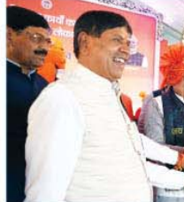
मुख्यमंत्री डॉ. मोहन यादव विदिशा में हितवाचन वितरित करते हुए

मुख्यमंत्री ने क्षेत्र के लिए 132 करोड़ रुपये से अधिक के विकास कार्यों का लोकार्पण एवं शिलान्यास किया। इनमें 80 करोड़ 16 लाख रुपये के 54 विकास कार्यों का भूमिपूजन और 51 करोड़ 96 लाख रुपये के 198 विकास कार्यों का