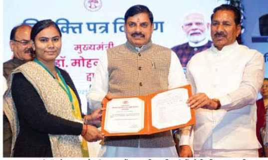
मुख्यमंत्री डॉ. मोहन यादव ने रवीन्द्र भवन में नव चयनित अधिकारियों को नियुक्ति पत्र प्रदान किए

भोपाल, मुख्यमंत्री डॉ. मोहन यादव रवीन्द्र भवन में संपन्न हुए नियुक्ति-पत्र वितरण कार्यक्रम में शामिल हुये। कार्यक्रम में कृषि, पशुपालन और राजस्व विभाग के लिए चयनित 362 शासकीय अधिकारियों-कर्मचारियों को नियुक्ति-पत्र वितरित किये गये। कार्यक्रम को संबोधित करते हुए मुख्यमंत्री ने कहा कि अधिकारी वह है, जो जनहित में कार्य करे। इस उद्देश्य से शासकीय सेवा में प्रवेश करना आवश्यक है। उन्होंने कहा कि प्रधानमंत्री श्री नरेन्द्र मोदी स्वयं को प्रधान सेवक मानते हैं। मध्यप्रदेश का मंत्रि-मंडल भी परस्पर सहयोग से जनता के सेवक के रूप में कार्य कर रहा है। पद पर आने के बाद हमारे मन में अहंकार नहीं होगा, इस संकल्प के साथ, समाज हित और प्रदेश के विकास के लिए समर्पण होकर अपने दायित्व निर्वहन में आगे बढ़ें।