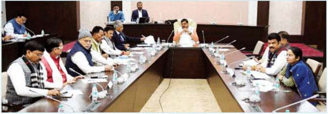
मुख्यमंत्री डॉ. मोहन यादव सिंहस्थ-2028 की तैयारियों के संबंध में आपाजित बैठक को संबोधित करते हुए

भोपाल, मुख्यमंत्री डॉ. मोहन यादव ने कहा कि सिंहस्थ-2028 में उज्जैन और इंदौर संभाग गतिविधियों के मुख्य केंद्र रहेंगे। इन संभागों में 2 ज्योतिर्लिंग होने से श्रद्धालुओं का आवागमन तथा धार्मिक गतिविधियां तुलनात्मक रूप से अधिक होंगी। इंदौर-उज्जैन संभाग में जारी विभिन्न विभागों के कार्य समय-सीमा में पूर्ण हों, यह मॉनिटरिंग प्रत्येक 15 दिन में सुनिश्चित करें। सक्षम स्तर के अधिकारी बैठक कर, कार्यों की प्रगति की समीक्षा करें। ऐसे विषय जिनमें उच्च स्तर से समय-या मार्गदर्शन आवश्यक है, वे विषय राज्य शासन के कार्यों में लाए जाएं। मिनिंग एजेंसियों को सौंप गए कार्यों की साप्ताहिक मॉनिटरिंग सुनिश्चित कर विलंब के कारणों का तत्काल निराकरण सुनिश्चित किया जाए।