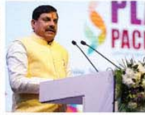
नेट मैनेजमेंट को बढ़ावा दिया जाएगा। सम्मेलन में प्लास्टिक उद्योग से जुड़ी 400 से अधिक कंपनियों और 2 हजार से अधिक प्रदर्शक शामिल हुये।

इंदौर, मध्यप्रदेश में प्लास्टिक उद्योग के विकास की अपार संभावनाएं हैं। यह उद्योग का नया क्षेत्र है और इसका बड़ा बाजार है। इस उद्योग में रोजगार के भी बेहतर और बड़े अवसर हैं। प्लास्टिक उद्योग के विकास के लिए इसके दुष्प्रभाव को दूर कर सावधानी रखते हुए आगे बढ़ेंगे। यह बात मुख्यमंत्री डॉ. मोहन यादव ने इंदौर में संपन्न हुए प्लास्टिक उद्योग सम्मेलन प्लास्टिक 2025 को संबोधित करते हुये कहा। मुख्यमंत्री ने कहा कि प्लास्टिक के दुष्प्रभावों को दूर करने के लिए एर्यूए और