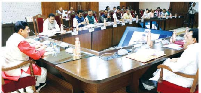
मुख्यमंत्री डॉ. मोहन यादव ने मंत्रालय में आयोजित मंत्रिपरिषद की बैठक को संबोधित किया

भोपाल, मुख्यमंत्री डॉ. मोहन यादव की अध्यक्षता में मंत्रिपरिषद की बैठक मंत्रालय में हुई। मंत्रिपरिषद द्वारा मध्यप्रदेश सिविल सेवा (महिलाओं की नियुक्ति के लिए विशेष उपबंध) नियम, 1997 में मुख्यमंत्री के आदेश दिनांक 13.09.2023 एवं इसके परिपालन में विभाग द्वारा जारी अधिसूचना 3 अक्टूबर, 2023 का अनुसमर्थन किया गया। इस निर्णय से महिला आरक्षण 35 प्रतिशत होगा।