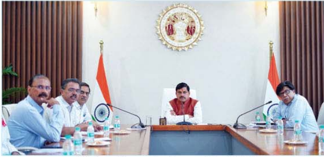
मुख्यमंत्री डॉ. मोहन यादव ने समस्त भवन में आयोजित उच्च स्तरीय बैठक को निर्देशित किया

भोपाल, मुख्यमंत्री डॉ. मोहन यादव ने समस्त भवन में आयोजित उच्च स्तरीय बैठक में कहा कि प्रदेश में राज्य स्तरीय हाथी टास्क फोर्स गठित किया जाएगा। हाथी-मानव सह-अस्तित्व सुनिश्चित करने के लिए हाथी मित्र बनाए जाएंगे। जिन क्षेत्रों में हाथियों की आवाजाही अधिक है, वहां किसानों की फसलों को बचाने के लिए सोलर फेंसिंग की व्यवस्था होगी। साथ ही किसानों को कृषि के अलावा कृषि वैज्ञानिक एवं अन्य वैकल्पिक कार्यों से भी जोड़ने के प्रयास होंगे। मुख्यमंत्री ने कहा कि मध्यप्रदेश में आने वाले समय में ऐसे वन क्षेत्र विकसित किए जाएंगे, जिसमें हाथियों की बसाहट के साथ सह अस्तित्व की भावना मजबूत हो सके। केंद्रीय वन मंत्री से भी इस संबंध में चर्चा हुई है। वे मार्गदर्शन करेंगे जिससे वन विभाग इस क्षेत्र में टोस कार्यवाही कर सके। जिन जिलों में हाथी वन क्षेत्रों में रह रहे हैं वहां हाथी मित्र जन-जागरूकता के लिए कार्य करेंगे।