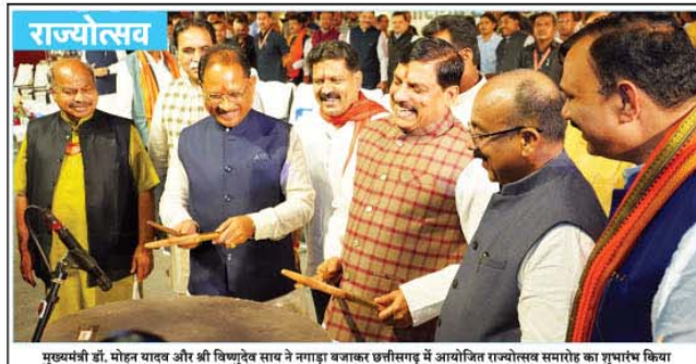
मुख्यमंत्री डॉ. मोहन यादव और श्री विष्णुदेव साय ने नागाड़ा बजाकार छत्रीसगढ़ में आयोजित राज्यतोस्तव समारोह का शुभारंभ किया

भोपाल, राज्य शासन द्वारा मध्यप्रदेश एवं राजस्थान सरकार के मध्य चीता परियोजना के लिये कॉरिडोर प्रबंधन के संबंध में संयुक्त समिति गठित की गयी है। प्रधान मुख्य वन संरक्षक एवं मुख्य वन्य-जीव अभिरक्षक, मध्यप्रदेश एवं राजस्थान को समिति का संयुक्त अध्यक्ष नियुक्त किया गया है। अपर प्रधान मुख्य वन संरक्षक वन्य-प्राणी मध्यप्रदेश-राजस्थान, संचालक सिंह परियोजना चीता प्रोजेक्ट शिवपुरी, क्षेत्र संचालक, संचालक, मुख्य वन संरक्षक संबंधित टाइगर रिजर्व सहित राजस्थान, राष्ट्रीय बाघ संरक्षण प्राधिकरण के प्रतिनिधि आदि को सदस्य मनोनीत किया गया है।