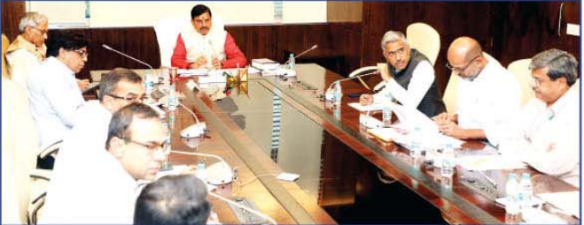
मुख्यमंत्री डॉ. मोहन यादव मंत्रालय में आयोजित विभागीय समीक्षा बैठक को संबोधित करते हुए