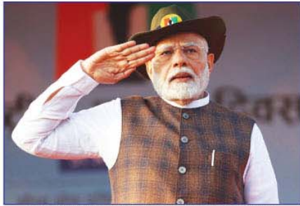
प्रधानमंत्री श्री नरेन्द्र मोदी राष्ट्रीय एकता दिवस समारोह परेड की सलामी लेते हुए।