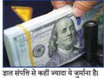
जात संपत्ति से कहीं ज्यादा ये जुर्माना है।

अमेरिकी बहुराष्ट्रीय टेक्नोलॉजी कंपनी गूगल इंटरनेट से जुड़ी कई सेवाएँ प्रदान करती है। इसे मुख्य रूप से एक संचर् इंडन के रूप में जाना जाता है। गूगल ने अपने ही लोगों की खिंदगी को फैलाना भी आसान करने में बनाया हो लेकिन क्विन्ता भी आसान कर इसे कई बार भारी जुर्माना का सामना करना पड़ा है।