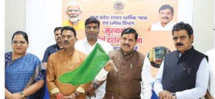
मुख्यमंत्री डॉ. मोहन यादव ने उज्जैन में तीर्थ-दर्शन यात्रा को हरी झंडी दिखाई

भोपाल, मुख्यमंत्री डॉ. मोहन यादव ने खेल एवं युवक कल्याण की विभागियों गतिविधियों की समीक्षा बैठक को संबोधित करते हुए कहा कि प्रदेश में मखलब और जिम्नैस्टिक को प्रोत्साहित करने के लिए उज्जैन में पृथक-पृथक अकादमी का निर्माण किया जाएगा। उन्होंने कहा कि साहसिक खेल गतिविधियों को पर्यटन एवं वन के साथ जोड़कर स्पोर्ट्स एडवेंचर के रूप में मुख्य खेलों में शामिल करें। मुख्यमंत्री ने कहा कि विभिन्न जिलों से सुवाओं का चयन कर साहसी खेल गतिविधियों का आयोजन किया जाए।