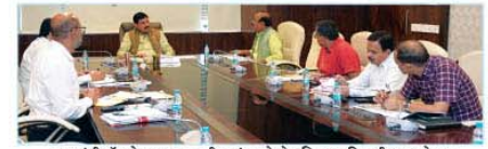
मुख्यमंत्री डॉ. मोहन यादव कुटीर एवं ग्रामोद्योग विभाग की समीक्षा करते हुए की जाए

भोपाल, मुख्यमंत्री डॉ. मोहन यादव ने मंत्रालय में कुटीर एवं ग्रामोद्योग विभाग योजनाओं की समीक्षा करते हुए कहा कि छोटे, पोल्त उद्योगों से जुड़े लघु व्यवसायियों को उनके उत्पाद के ऑनलाइन विक्रय की सुविधाएं उपलब्ध करवाने के लिए कुटीर और ग्रामोद्योग विभाग प्रयास बढ़ाए। अपने पोर्टल के विकास के साथ कुटीर और ग्रामोद्योग विभाग लघु और सूक्ष्म उद्योगों का संचालन करने वाले व्यवसायियों की उत्पत्ति के लिए नोडल विभाग की भूमिका में कार्य करें। प्रदेश में उत्पादित ऐसे उत्पाद प्रदेश और देश में विक्राने के साथ ही भविष्य में निर्यात किए जा सकें, इस लक्ष्य को ध्यान में रखकर कार्य किया जाए। भोपाल हाट और प्रदेश के अन्य स्थानों पर महिला व्यवसायियों के लिए सामाजिक महिला हाट में विभिन्न उत्पादों की बिक्री की व्यवस्था