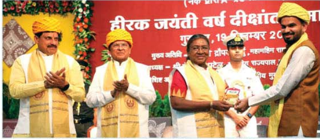
राष्ट्रपति श्रीमती द्रौपदी मुर्मु ने इंदौर में देवी अहिल्याबाई विश्वविद्यालय के दीक्षांत समारोह में विद्यार्थियों को उपहारित प्रदान कीं

इंदौर, बेटियों को शिक्षित तथा आत्मनिर्भर बनाने तथा देश के सर्वांगीण विकास के लिये सामूहिक प्रयासों की जरूरत है। देवी अहिल्याबाई होलकर महिला सशक्तिकरण और आत्मनिर्भरता का उत्तम उदाहरण हैं। देवी अहिल्याबाई होलकर ने कुशल प्रशासन, न्याय परायणता और कल्याणकारी कार्यों में कई मान्य स्थापित किये हैं। यह बात राष्ट्रपति श्रीमती द्रौपदी मुर्मु ने इंदौर में देवी अहिल्या विश्वविद्यालय के हीरक जयंती समारोह अवसर पर 14वें दीक्षांत समारोह को सम्बोधित करते हुए कही। समारोह में राष्ट्रपति श्रीमती मुर्मु ने विद्यार्थियों तथा शोभायियों को स्वर्ण तथा रजत पदक और उपहारित वितरित कीं।