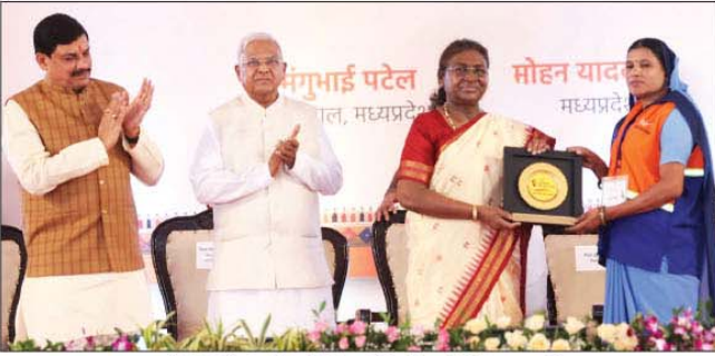
राष्ट्रपति श्रीमती द्रौपदी मुर्मू ने उज्जैन के ग्राम डेंडिया में सफाई-मित्रों का सम्मान किया।

उज्जैन, स्वच्छ भारत, स्वस्थ भारत और विकसित भारत के निर्माण के लिये सभी आगे बढ़ें। स्वच्छता ही देश को स्वस्थ और विकसित बना सकती है। देश का प्रत्येक व्यक्ति इसमें सहयोग करें और सब मिलकर देश को विकसित राष्ट्र बनायें। मध्यप्रदेश ने शहरी और ग्रामीण स्वच्छता के क्षेत्र में अग्रणी स्थान प्राप्त किया और यहां के कई