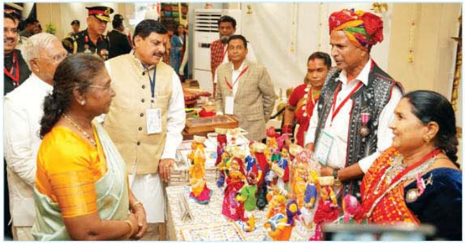
राष्ट्रपति श्रीमती द्रौपदी मुर्मू ने इंदौर प्रवास के दौरान मृगवन्दी एम्पॉरियम इंदौर में शिल्पकारों से बात की

इंदौर, राष्ट्रपति श्रीमती द्रौपदी मुर्मू ने इंदौर प्रवास के दौरान मृगवन्दी एम्पॉरियम में बुनकरों द्वारा हाथकरियां पर तैयार की गई रेशम एवं कौटन की चंदेरी, महेश्वरी साड़ियों को देखा। इस दौरान उन्होंने जनजातीय क्षेत्र के हस्तशिल्पी, बुनकरों एवं जनजाति कारीगरों से रूबरू चर्चा की और उनकी कला को सराहा। राष्ट्रपति श्रीमती मुर्मू को कलाकारों ने अपने हाथों से निर्मित हस्तशिल्प प्रेंट भी किया। यह सभी कलाकार अपनी विधा में पारंगत हैं और राष्ट्रीय स्तर पर इनकी एक अलग ही पहचान है। राष्ट्रपति से मुलाकात को लेकर सभी कलाकार बहुत उत्साहित थे और उनसे मिलकर बहुत खुश हुए कि उन्हें देश के सर्वोच्च पद पर आसीन श्रीमती मुर्मू से रूबरू मिलने तथा चर्चा करने का अवसर मिला। इस अवसर पर राज्यपाल श्री मंगुभाई