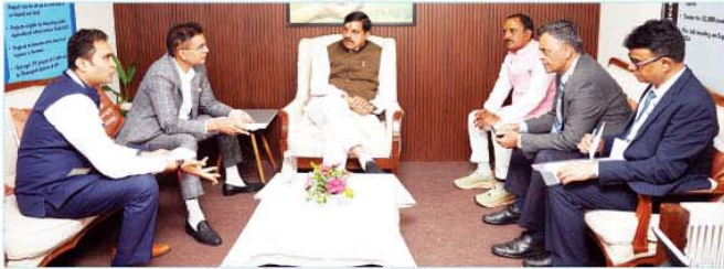
मुख्यमंत्री डॉ. मोहन यादव चौधे ग्लोबल रीन्यूएबल एनर्जी इन्वेस्टर मीट में निवेशकों से वार्ता करते हुए

गांधीनगर, चौधे ग्लोबल रीन्यूएबल एनर्जी इन्वेस्टर मीट के दूसरे चरण में विभिन्न देशों के मुख्यमंत्रियों के मध्य गहन विचार-विचारों हुआ। मध्यप्रदेश में मुख्यमंत्री डॉ. मोहन यादव ने कहा कि प्रधानमंत्री श्री नरेन्द्र मोदी द्वारा 'पंचामृत' का संकल्प, वर्ष 2070 तक नेटो ज़ीरो एमिशन का लक्ष्य प्राप्त करना, वर्ष 2030 तक गैर परंपरागत ऊर्जा क्षमता 500 गीगावाट तक बढ़ाना, वर्ष 2030 तक सकल ऊर्जा उत्पादन में नवकरणीय ऊर्जा का हिस्सा बढ़ाकर 50 प्रतिशत तक ले जाना, एमिशन का तीव्रता को 45 प्रतिशत घटाना और कार्बन उत्सर्जन में 2030 तक 1 बिलियन टन की कमी लाने के लिये पूरे विश्व को नई दिशा दी है।