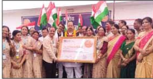
बच्चे 21वीं सदी के कोशल से सुसज्जित हों