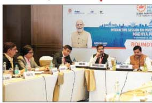
सीमेट, स्टील, प्लास्टिक और नवकणीय ऊर्जा सहित विभिन्न क्षेत्रों से लगभग 20 हजार करोड़ रुपये के निवेश प्राप्त हुए, जिससे 9,450 रोजगार के अवसर सृजित होंगे।

प्रदेश में निवेश व औद्योगिक गतिविधियों को बढ़ाने के लिए कोलकाता सहित देश के बड़े औद्योगिक नगरीय में उद्योगपतियों से चर्चा सत्र आयोजित किया गया। समिट में खाद्य प्रसंस्करण, रसायन,