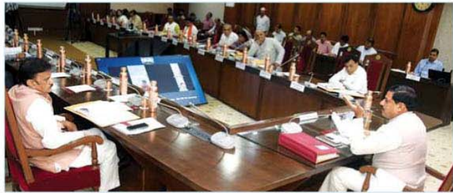
मुख्यमंत्री डॉ. मोहन यादव की अध्यक्षता में मंत्रालय में कैबिनेट बैठक सम्पन्न हुई

भोपाल, मुख्यमंत्री डॉ. मोहन यादव की अध्यक्षता में मंत्रिपरिषद की बैठक मंत्रालय में हुई। मंत्रिपरिषद द्वारा अनुबन्धित एजेंसी से सिंहस्थ-2028 के आयोजन के लिए समय-सीमा में कार्य पूर्ण करने की मंजूरी आवस्यकता के दृष्टिगत प्रो-टेन्टा आधार पर 'कान्ह डायवर्सन क्लोज डक्ट परियोजना' लागत राशि 919 करोड़ 94 लाख रुपये की पुनरीक्षित प्रशासकीय स्वीकृति प्रदान की गई।