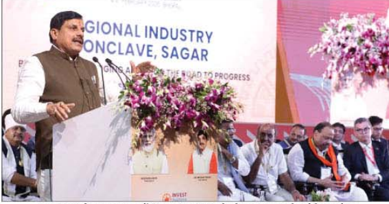
मुख्यमंत्री डॉ. मोहन यादव सागर में रीजनल इंडस्ट्री कॉन्क्लेव के शुभारंभ सत्र को संबोधित करते हुए

सागर, प्रदेश में उद्योगों के विकास का कार्य निरंतर जारी रहेगा। छोटे से छोटे उद्यमी की आवश्यकता के लिए भी राश्य सरकार पूर्ण सहायता प्रदान करेगी। केम-बेतवा परियोजना क्रियान्वयन से बुन्देलखंड के ढाई लाख हेक्टेयर में सिंचाई क्षमता की वृद्धि होगी, जिससे बुन्देलखंड क्षेत्र का स्वरूप बदल जायेगा। यह बात मुख्यमंत्री डॉ. मोहन यादव ने सागर में रीजनल इंडस्ट्री कॉन्क्लेव के शुभारंभ सत्र को संबोधित करते हुए कहा। मुख्यमंत्री ने कहा कि सागर में एयरपोर्ट का निर्माण होगा जिससे एविएशन क्षेत्र में संभावनाएं बढ़ेंगी।