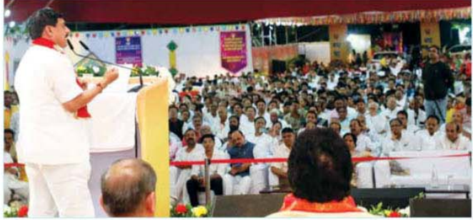
मुख्यमंत्री डॉ. मोहन यादव ने सागर में आयोजित धामावाणी महोत्सव में शामिल जैन सद्युक्त के विशिष्टजनों को संबोधित किया

सागर, मुख्यमंत्री डॉ. मोहन यादव सागर में आयोजित धामावाणी महोत्सव में शामिल हुए। उन्होंने कहा कि सागर मेडिकल कॉलेज का नाम 'आचार्य विद्यासागर मेडिकल कॉलेज' होगा। उन्होंने जैन धर्मावलम्बियों को बड़ी सौगात देते हुए कहा कि प्रदेश में जैन कल्याण बोर्ड का गठन किया जायेगा। मुख्यमंत्री ने कहा कि सरकार सर्वोच्च प्राथमिकता से जैन मुनियों को उनके विहार के दौरान नगरीय क्षेत्र या ग्रामीण क्षेत्र में भवन की आवश्यकता होने पर निःशुल्क भवन सुविधा उपलब्ध करायेगी। उन्होंने कहा कि जैन धर्म और संस्कृति का गौरवशाली इतिहास है। देश-