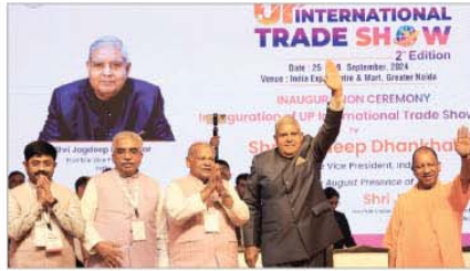
उपराष्ट्रपति श्री जगदीप धनखड़ अंतर्राष्ट्रीय व्यापार शो-2024 के शुभारंभ अवसर पर

भारत अब दुनिया की सबसे तेजी से बढ़ने वाली अर्थव्यवस्थाओं में से एक और वैश्विक निवेश के लिए एक प्रसिद्धि स्थान है। यह बात उपराष्ट्रपति श्री जगदीप धनखड़ ने उत्तर प्रदेश के ग्रेटर नोएडा में आयोजित अंतर्राष्ट्रीय व्यापार शो-2024 के शुभारंभ अवसर पर कही। उपराष्ट्रपति ने कहा कि भारत लगभग 4 ट्रिलियन डॉलर की अर्थव्यवस्था है, जिसमें आने वाले दशकों में 8 प्रतिशत की वृद्धि की संभावना है। उपराष्ट्रपति श्री धनखड़ ने देश के नुनयादी ढांचे के विकास की प्रशंसा करते हुए कहा कि 8 मं हवाई अड्डों के जुड़ने, मेट्रो प्रणालियों के तेजी से विस्तार